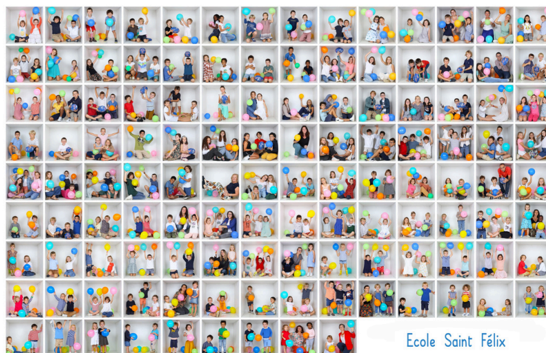
Ecole Saint Félix